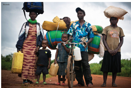
les familles doivent plier bagage et chercher un endroit où vivre en sécurité.