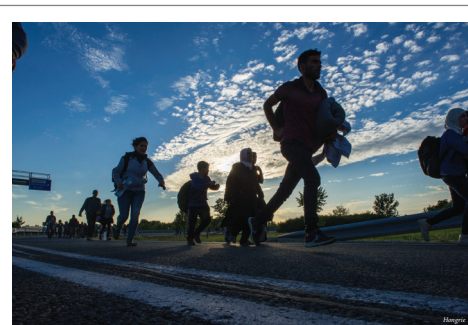
ou au pas de course, dans l'espoir de trouver un endroit sûr.