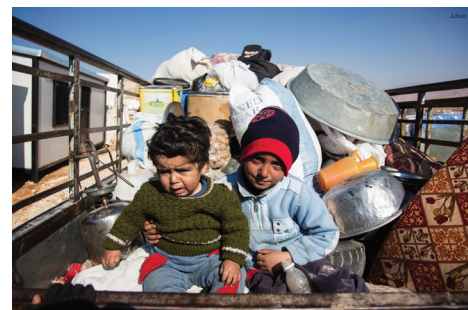
Elles partent en voiture.