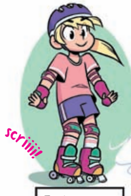
Freiner sans tomber