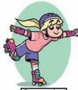
Essayer des figures