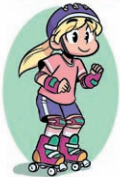
Rouler vers l'avant