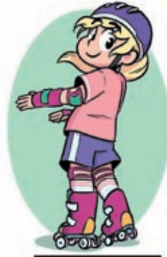
Reculer (pas très vite)